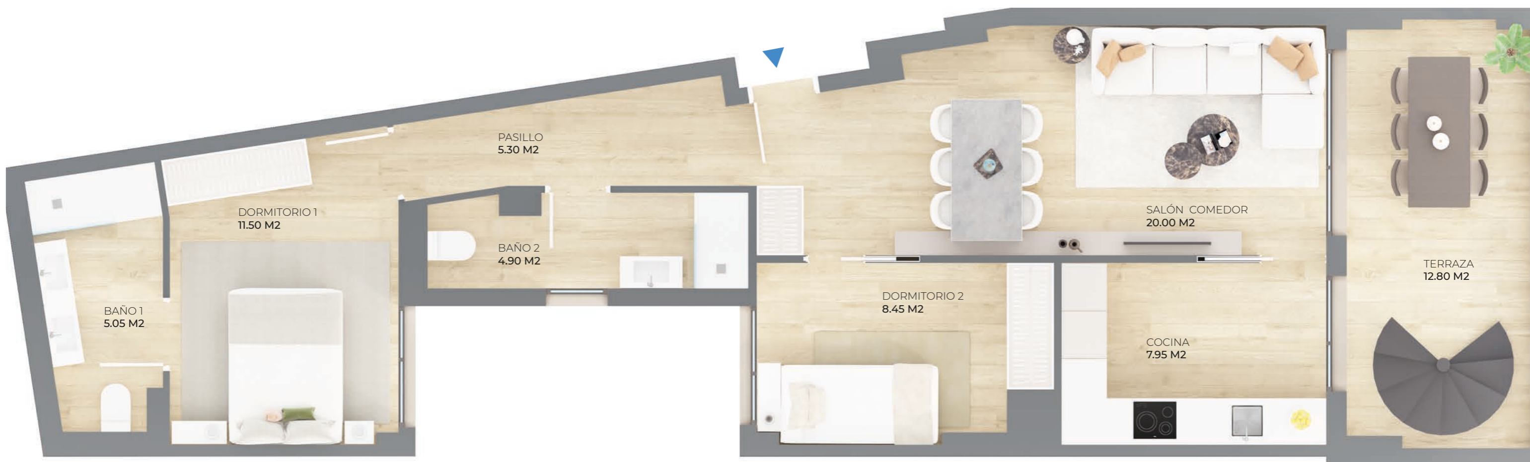
PLANTA 4 a